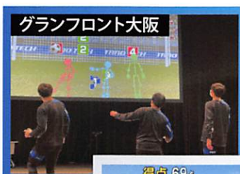
グランフロント大阪