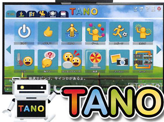
抽選やピンゴ、サイコロがあるよ。

実際に綱引きをしている動きをしてください。モーションセンサーが動きを読み取り、得点になります。